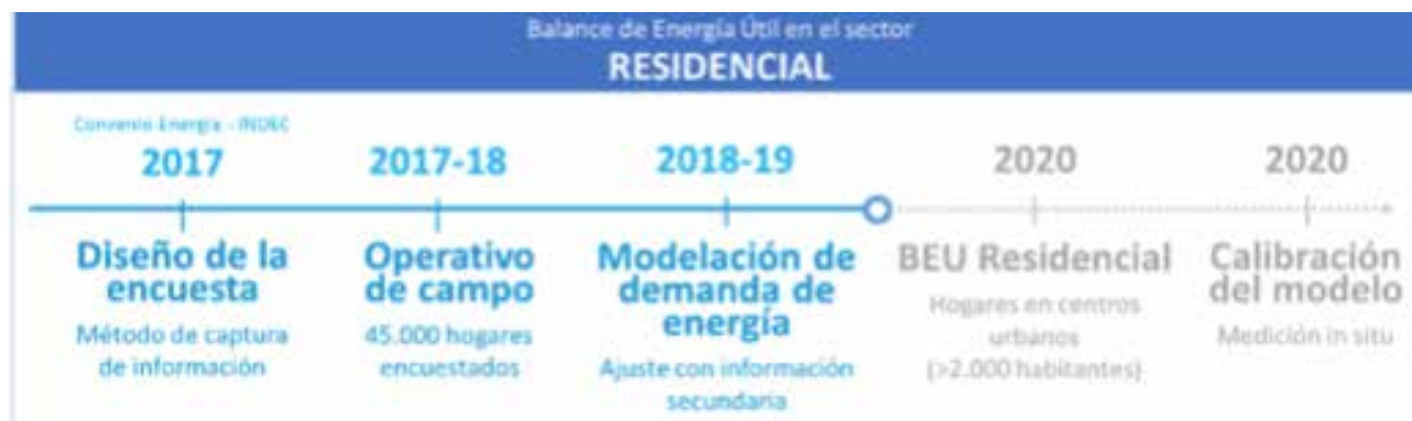
Figura: BNEU en el Sector Residencial.

Entre ellas, destacamos la incorporación de preguntas acerca del uso de la energía en la Encuesta Nacional de Gastos en los Hogares (ENGHo), cuyo operativo tuvo lugar durante 2017 y 2018, y alcanzó 45.000 hogares. El Balance Nacional de Energía Útil (BNEU) del Sector Residencial , que debía ser elaborado a partir del procesamiento de los datos obtenidos en la ENGHo 2017 - 2018 , resultó inconcluso por la inacción de la actual administración de gobierno y la disolución del equipo de trabajo dedicado al asunto.